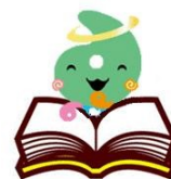
埼玉県社協マスコット 「シャキたまくん」