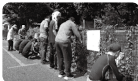
〈夏のボランティア体験〉