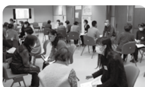
〈ボランティア講座〉