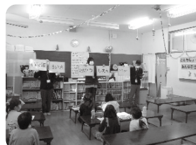
〈認知症サポーター養成講座〉