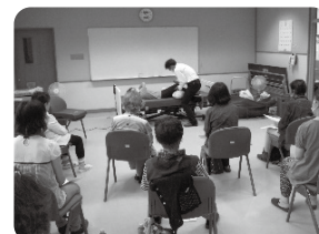
〈介護者学習交流会〉