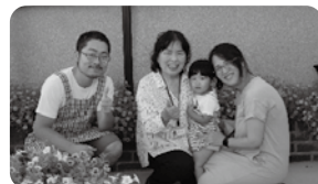
〈利用会員・協力会員〉