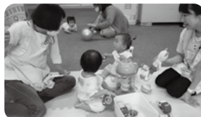
〈託児ボランティア〉