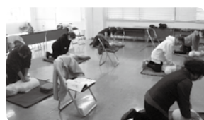
〈ステップアップ研修会〉